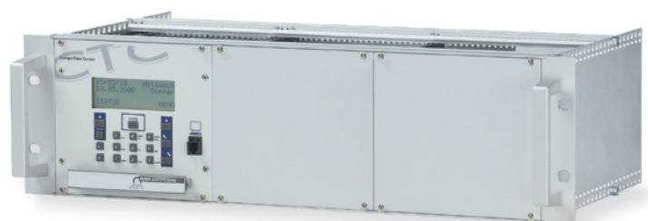
19" Akku-Modul AB M24-3.2