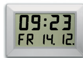
LC 310 - C