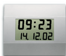
LC 410 - C