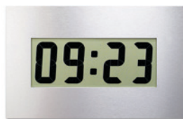
LC 90 - C

LCD-Uhren- und Kalenderuhren für Innenräume