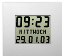
LC 210 - CW