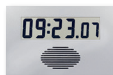
LC 75 - CLP 1