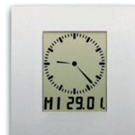
LC 200 - AC