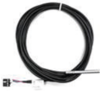
TP3 (3 m Anschlusskabel) TP30 (30 m Anschlusskabel)