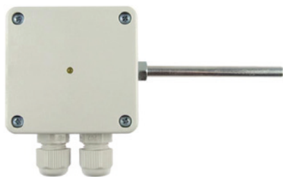
TP RS485 O