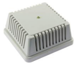
TP RS485 I