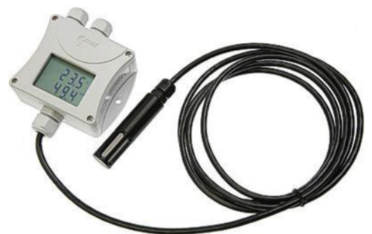
TPHB RS485 4 m