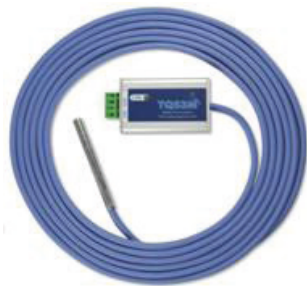
TP RS485 M