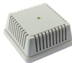
TP RS485 I