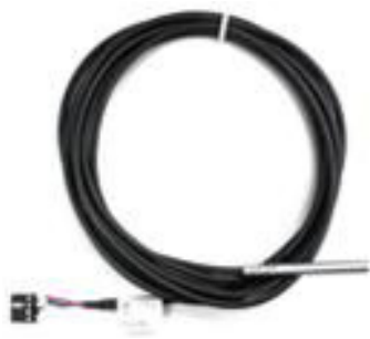
TP3 (3 m Anschlusskabel) TP30 (30 m Anschlusskabel)